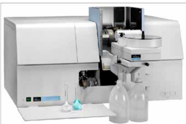
Spectrométrie d'absorption atomique - 7000

Le principe de la spectrométrie d'émission par ICP (Inductively Coupled Plasma) est basé sur l'analyse de radiations émises par des atomes excités[2].