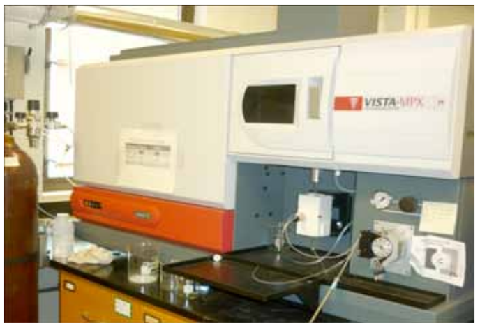
Spectrométrie d'émission atomique avec plasma induit (ICP-AES)

(spectrométrie d'absorption atomique à atomisation par flamme ou FAAS) soit un dispositif électrothermique, la plupart du temps un four graphite (spectrométrie d'absorption atomique en four graphite ou GFAAS) [1-3].