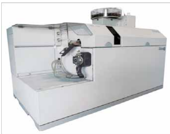
Spectrométrie d'émission atomique couplée à la spectrométrie de masse (ICP-MS)

Elle est également très intéressante pour ses capacités d'analyse multi élémentaire et dépasse les performances de l'ICP d'émission.